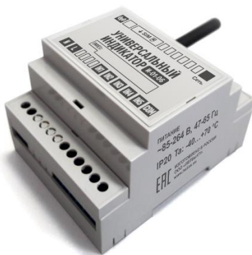
Рисунок 1. Универсальный индикатор И-01-06