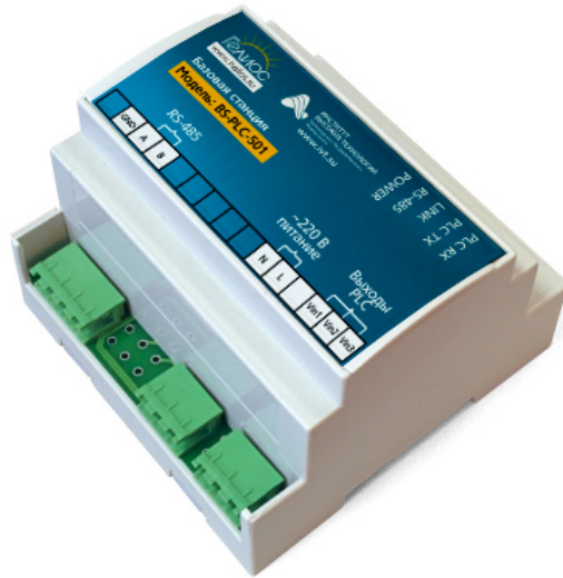
Рисунок 1. Базовая станция BS-PLC-501

2.4.2. Фотография Изделия приведена на рисунке 1.