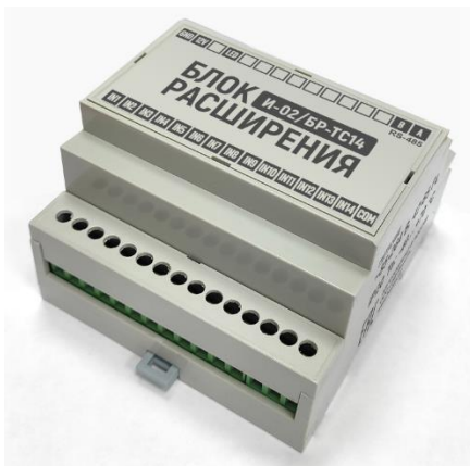
Рисунок 1. Блок расширения И-02/БР-ТС14