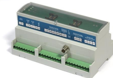
Рис. 1. Модуль управления и мониторинга «Гелиос» УН-912