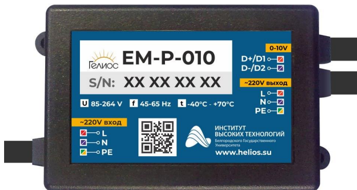
Рис. 1. Устройство управления светильниками, марка «Гелиос» PLC-010 (EM-P-010)