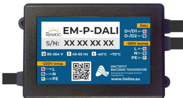
Рис. 1. Устройство управления светильниками, марка «Гелиос» PLC-DALI (EM-P-DALI)