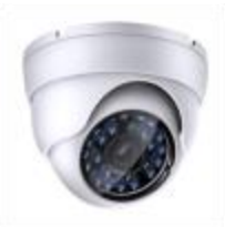
Камеры «цифрового зрения»

служит для предварительного уведомления водителей о пешеходах