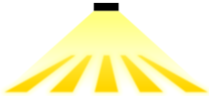
Светодиодная проекция «зебры»

служит для привлечения внимания водителей