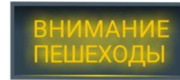
Информационное табло «Внимание пешеходы»

пешеходного перехода со светодиодной подсветкой