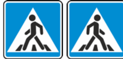
Знаки 5.19.1 и 5.19.2

служит для привлечения внимания водителей